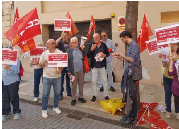
PALMA DE MALLORCA