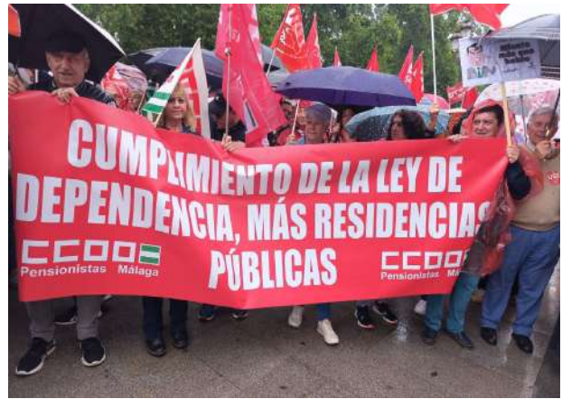
SEVILLA (compañeros y compañeras de Málaga)