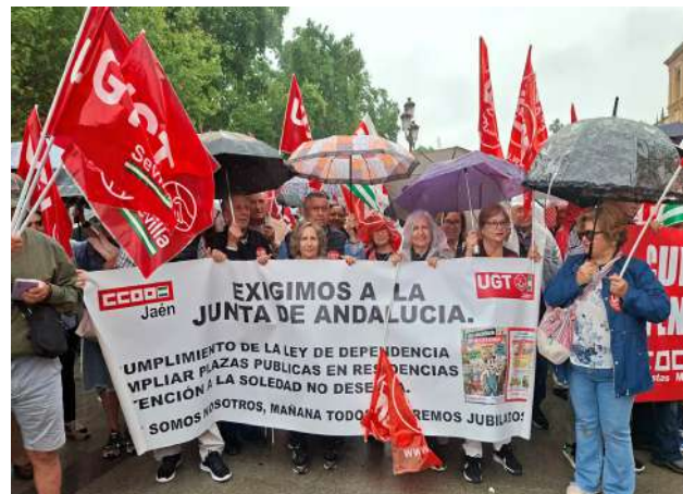
SEVILLA (compañeros y compañeras de Jaén)